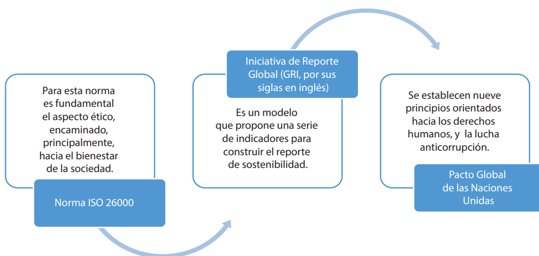
Figura 2 Principales guías para la elaboración de informes de sostenibilidad

por buscar la mejor manera de mostrárselos a sus stakeholders a través de los llamados informes de sostenibilidad. Para ello existen algunas guías; por ejemplo: