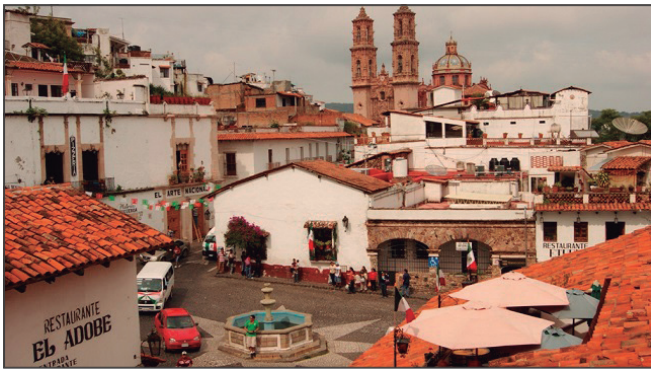
Foto 3. La conservación de la ciudad tradicional reafirma la identidad y significado del espacio urbano.

En el año 1985 la ciudad fue declarada Patrimonio de la Humanidad por la UNESCO. Se elaboró un Plan de Rehabilitación de la Ciudad Histórica, que pretendía recuperar y proteger las funciones urbanas del centro histórico y la defensa y reconstrucción de los valores urbanos y arquitectónicos de la ciudad.